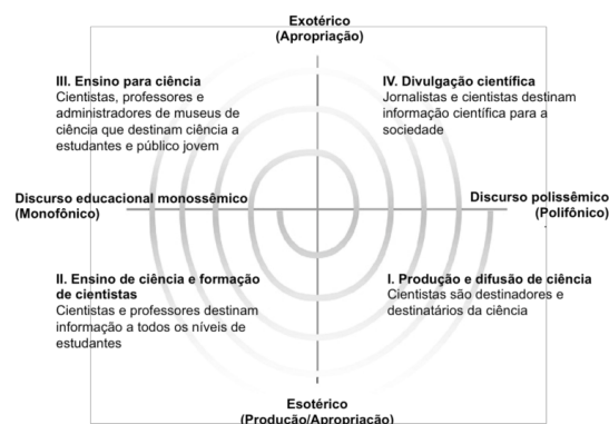
Figura 1: A Espiral da Cultura Científica.

O modelo de espiral, proposto por Vogt (2003), pretende representar a dinâmica constitutiva das relações próprias e necessárias entre Ciências e cultura. A Espiral da Cultura Científica é, portanto, uma forma de melhor compreender a Cultura Científica.