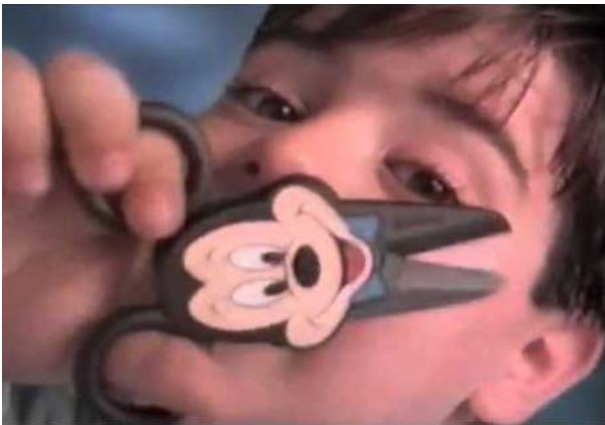
Figura 14 - Comercial empresa Mundial, “Eu tenho, você não tem”, 1992.