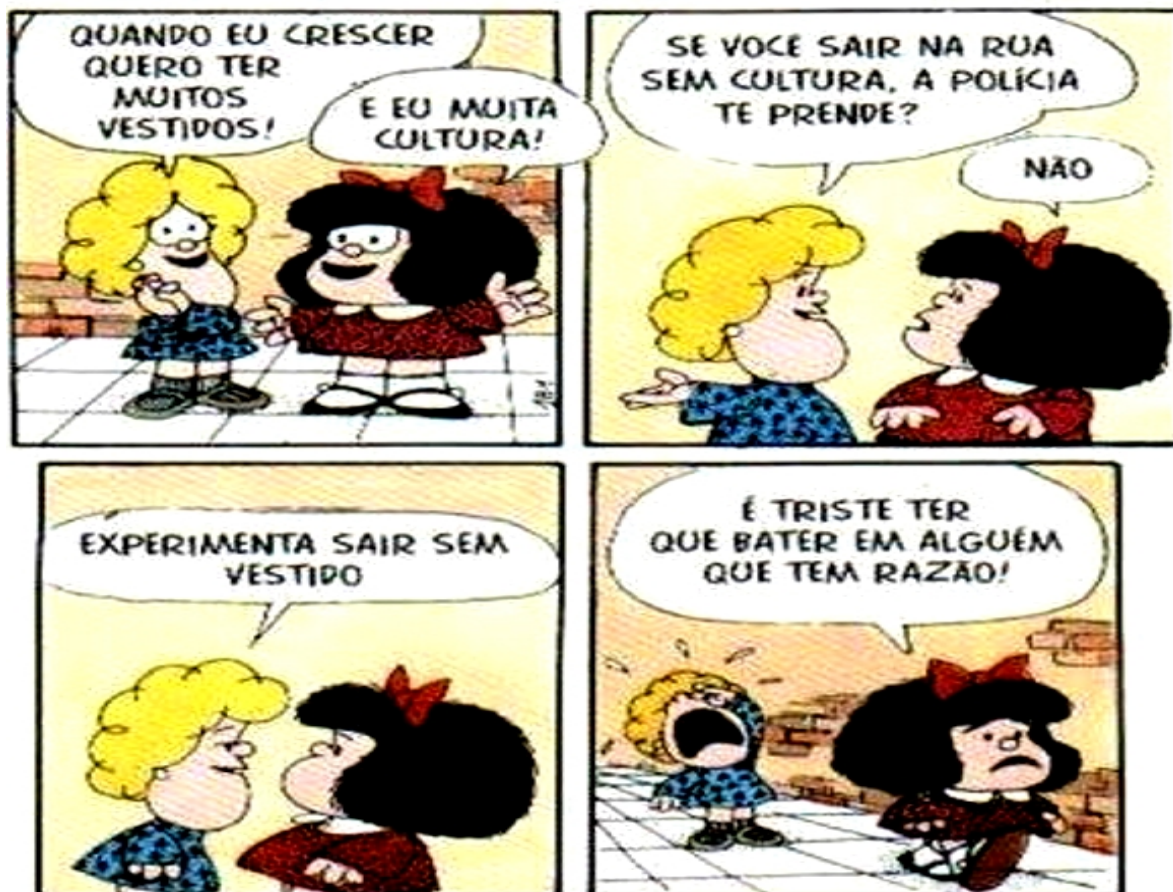
Figura 3 - Tira Mafalda, “Psicologia cultural”.

Para Vygotsky (2006, p. 60), a abordagem dialética na visão da psicologia baseou-se em três princípios fundamentais: “os fenômenos devem ser examinados como parte de um processo de desenvolvimento; a mudança não ocorre em uma progressão evolutiva linear, mas através de transformações qualitativas; essas transformações ocorrem através da união de processos distintos e contraditórios”. A ideia fundamental da teoria histórico-cultural é que as pessoas de diferentes culturas e épocas têm processos mentais superiores diferentes. Assim, para a psicologia histórico-cultural, abordar o fenômeno psicológico implica falar de sociedade; discutir a questão da subjetividade humana implica pensar sobre a objetividade em que vivem os homens (figura 3). Compreender o mundo interno exige compreender o mundo externo, já que ambos fazem parte de um mesmo processo no qual o homem atual modifica o mundo, e este fornece elementos para a constituição psicológica do homem, segundo Bock et al. (2002).