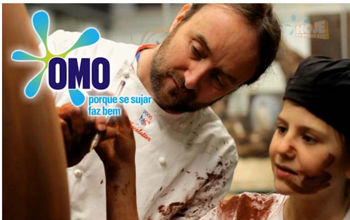
Figura 15 - Comercial empresa OMO, “Porque se sujar faz bem”, 2010.

Fonte: < http://www.unilever.com.br/brands/our-brands/omo.html >. Acesso em: 12 Jul. 2016.