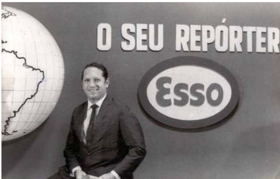
Figura 11 - “Repórter Esso”, 1952.