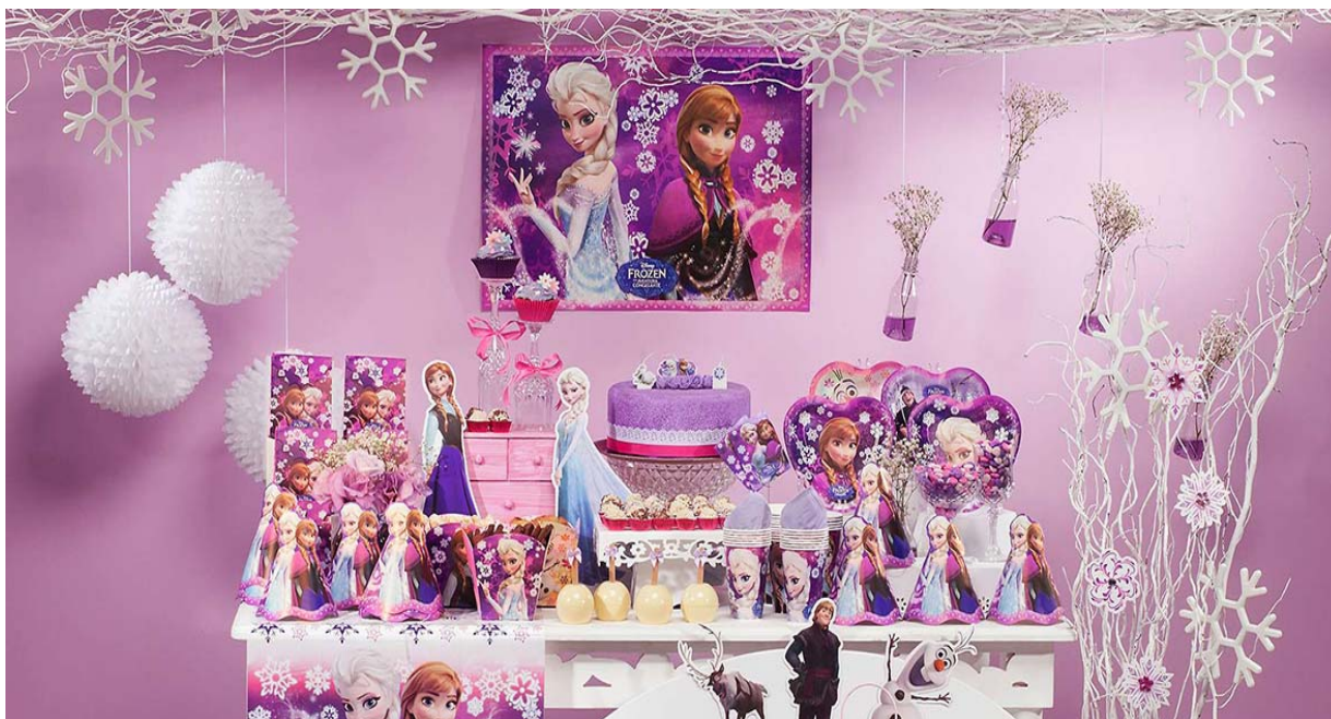
Figura 18 - Filme Disney, “Frozen - Uma aventura congelante”.

Fonte: < http://disney.mercadopme.com.br/Frozen >. Acesso em: 20 Fev. 2016.