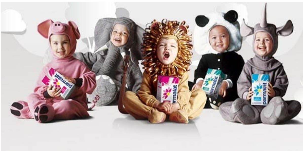
Figura 16 - Comercial empresa Parmalat, “Tomou?”, 1996.