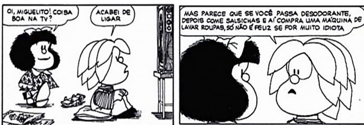
Figura 5 - Tira Mafalda, “A significação do meio para a personalidade infantil”.

Na figura 5, Mafalda contrapõe um diálogo com o amigo Miguelito ao que está sendo transmitido pela TV; fica evidente que a mensagem utilizada pelo transmissor induz ao consumismo de produtos. Já que se percebe pela análise que os personagens são conduzidos a usarem os produtos anunciados nos comerciais e programas exibidos pelo veículo televisão, pois, dessa forma, a aceitabilidade do receptor ao uso de itens fará deste uma pessoa mais feliz.