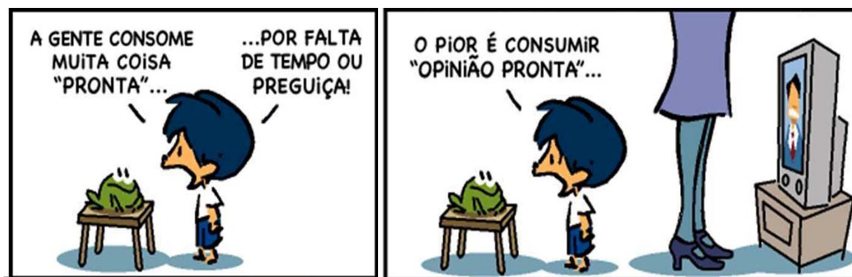
Figura 8 - Tira Armandinho, “O consumo”.