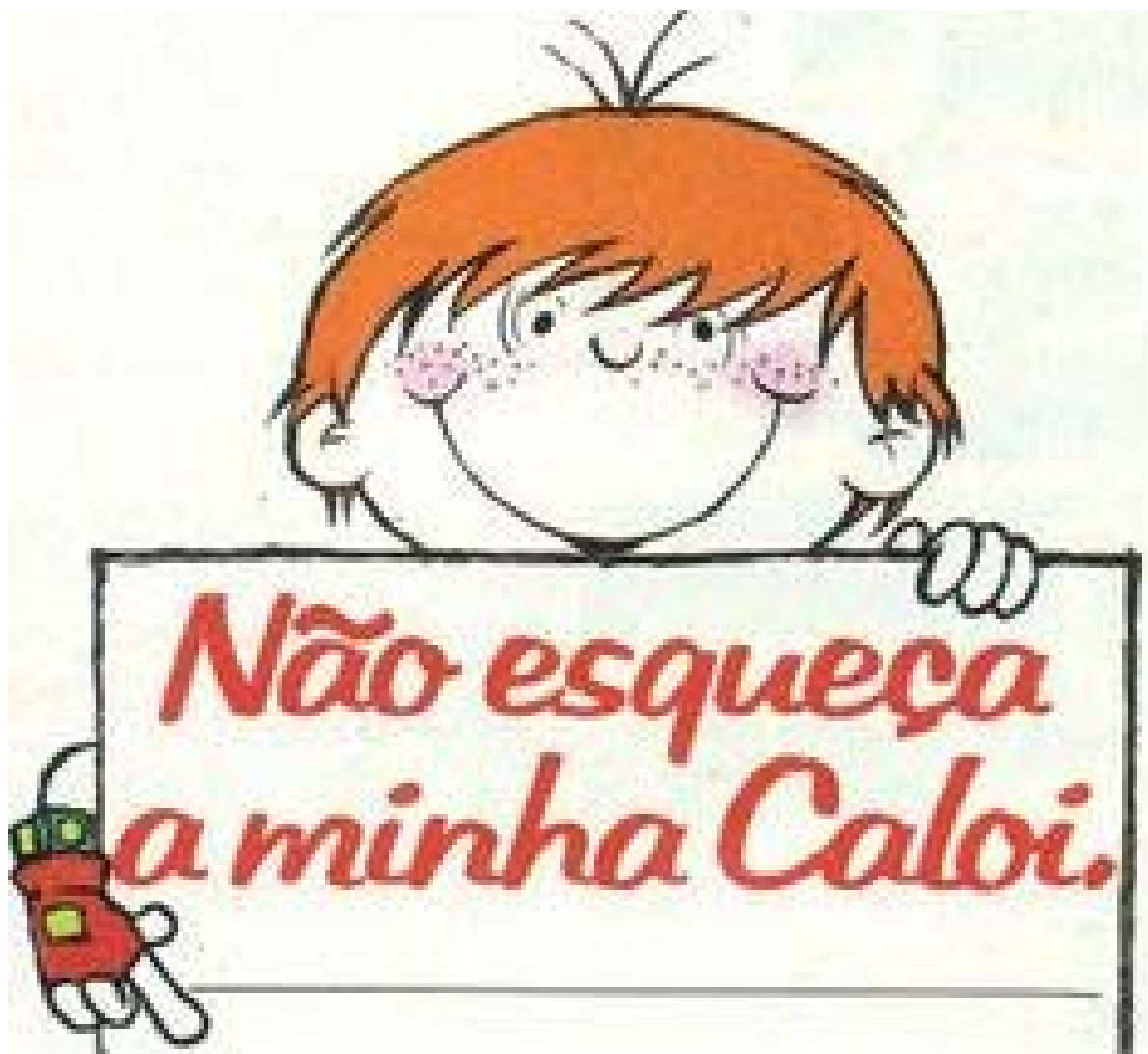
Figura 13 - Comercial empresa Caloi, “Não esqueça a minha Caloi”, 1978.