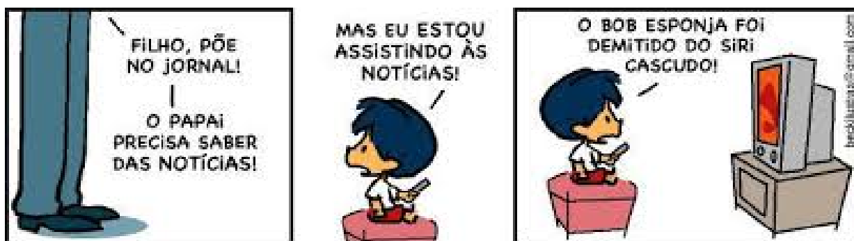
Figura 9 - Tira Armandinho, “O estímulo do meio e seus conteúdos”.

Segundo Carmona (2002, p. 75), as crianças “sempre foram vistas como consumidores pela televisão e, sendo assim, os programas produzidos para elas estão invariavelmente mais preocupados com os interesses comerciais do que com os aspectos sociais ou educacionais” (figura 9).