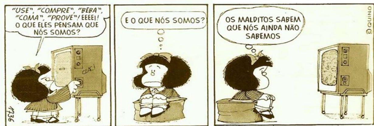
Figura 1 - Tira Mafalda, “Revolta com o estado atual do mundo”.