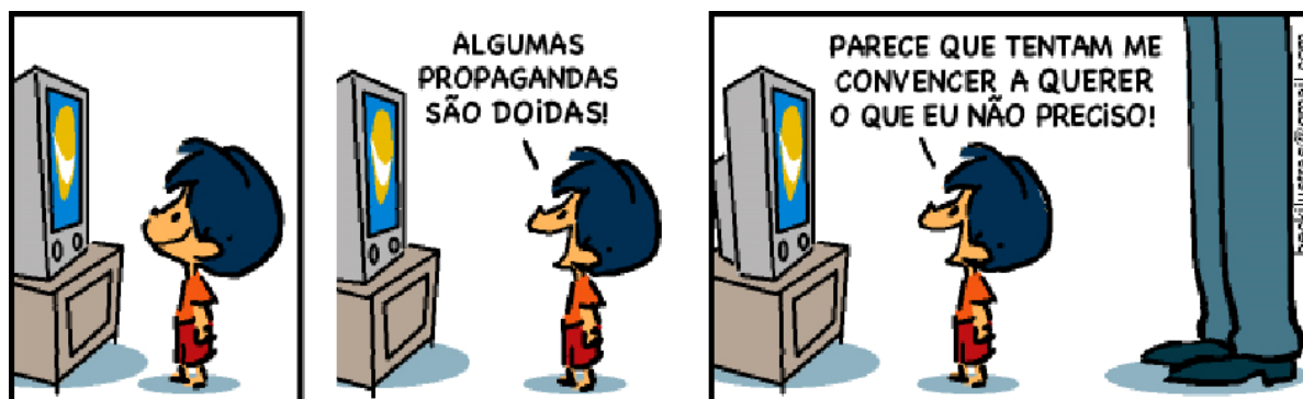
Figura 7 - Tira Armandinho, “Poder midiático e o mercado de consumo”.