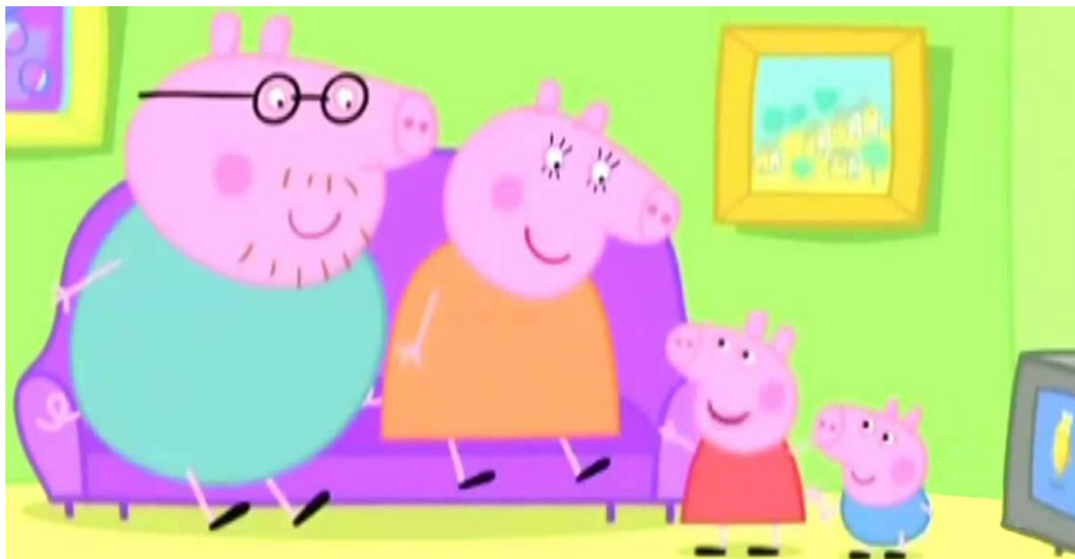
Figura 10 - Desenho televisivo “Peppa e sua família”.