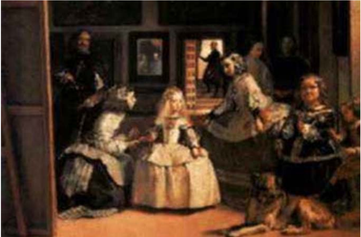
Figura 2 - Pintura “As Meninas”, Diego Velázquez, 1656.