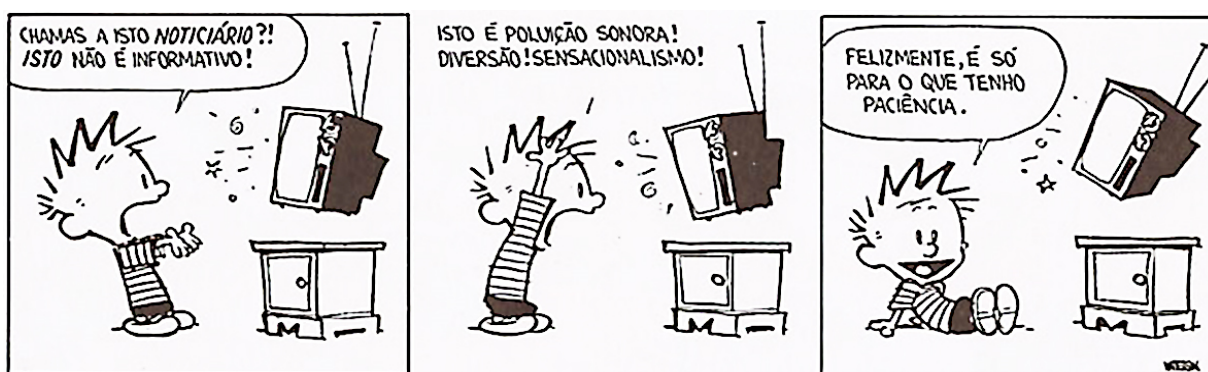
Figura 4 - Tira Calvin, “Canal de comunicação tevê como vínculo social”.

Ainda segundo o mesmo autor, nesse processo parece então razoável ligar o nascimento cultural da criança à necessidade básica que tanto ela quanto o outro têm de estabelecer vínculos sociais por meio do canal de comunicação de que dispõe cada um deles. Para Calvin (figura 4), personagem criada pelo cartunista Bill Watterson e que é uma criança, com narrativas em linguagem infantil, seus diálogos direcionam-se para temas polêmicos que estão associados ao mundo dos adultos.