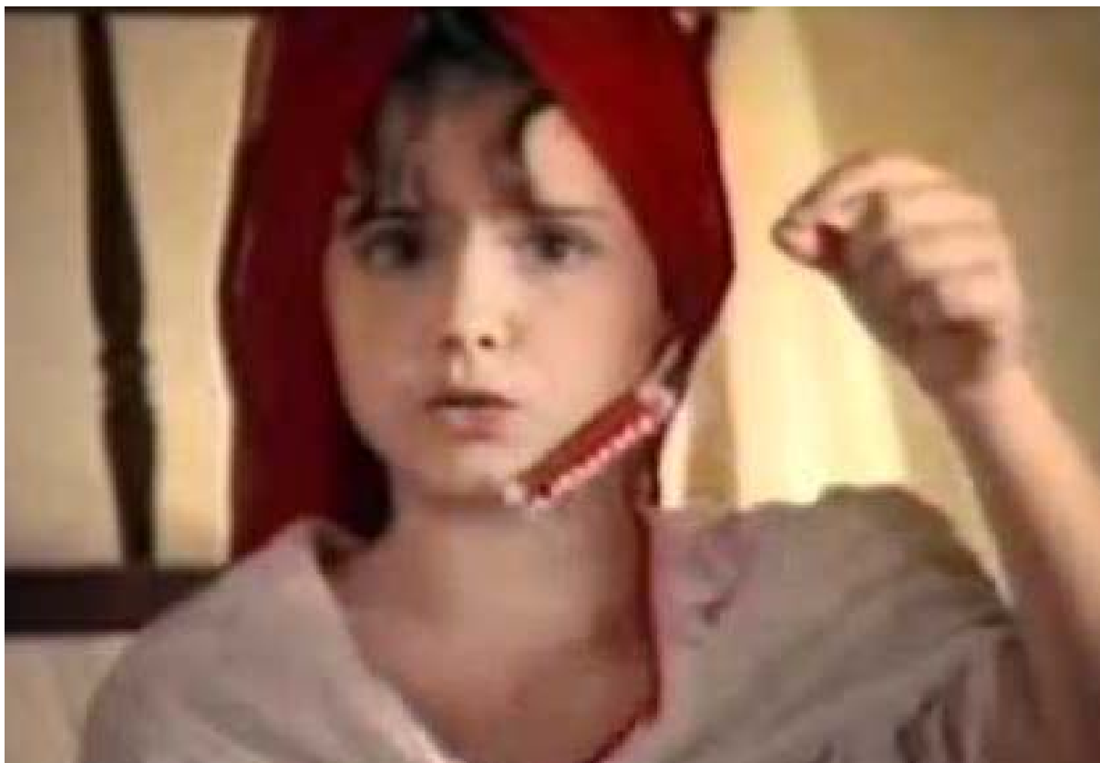
Figura 12 - Comercial empresa Garoto, “Compre Batom!”, 1990.