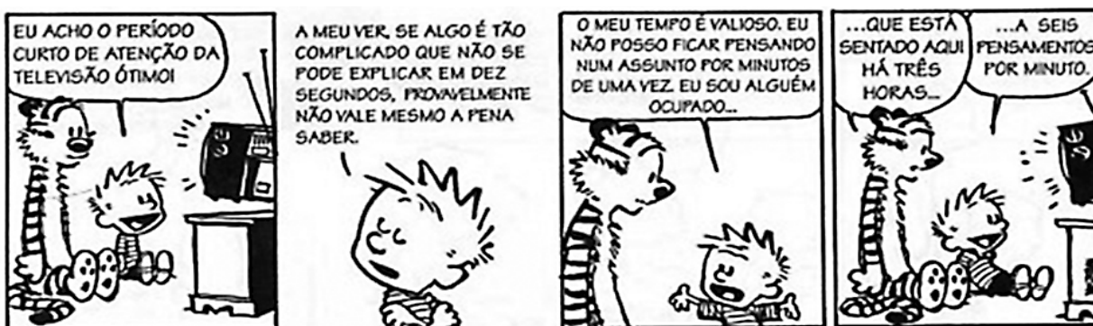
Figura 17 - Tira Calvin e Haroldo, “A televisão”.

Segundo Gonzales (2003), com objetivo em despertar no consumidor o desejo de possuir o produto, a publicidade tem o caráter primordial na venda e na obtenção de lucro. A relação entre as campanhas publicitárias e a indústria televisiva trabalha a comunicação de uma forma indispensável em prol da concretização do impacto da marca sobre o público-alvo. Além do formato do comercial tradicional de 30 segundos, há outros espaços, como o merchandising (inserção da marca, produto ou serviço em um programa), que está em crescimento constante, pois faz uso do tempo que a criança passa em frente à TV (figura 17).