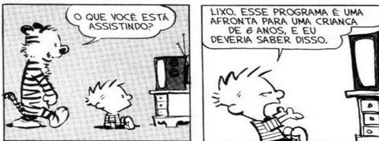
Figura 19 - Tira Calvin e Haroldo, “Conteúdos televisivos”.

É fato que, assoberbadas de obrigações, as mães utilizam-se da tevê como babá eletrônica para distrair os filhos, até mesmo inserindo o aparelho no cômodo da criança, sem terem noção do que ela está assistindo ou mesmo do tempo desperdiçado frente ao aparelho. Ao analisar a figura 19, percebe-se que o discurso televisivo consiste sempre em dizer coisas irônicas e evidentemente absurdas para persuadir seu público. Afinal, uma produção, seja ela comercial ou institucional, não convence com uma inocente solicitude de compra do produto desejado. Com essa visão crítica já formada da TV, Calvin e seu amigo enfatizam a má qualidade dos programas televisivos, assim como já induzem a vermos a mídia e seus conteúdos de maneira diferente.