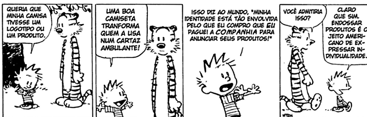
Figura 6 - Tira Calvin, “Vocação consumista”.

Ainda segundo Bauman (2008), esse processo de dependência do consumo cria o que ele chama de vocação consumista, imposta pelo mercado de forma que faça com que as pessoas sintam a necessidade de possuir produtos de que não têm necessidade (figura 6). Percebe-se, pelo gênero textual da tira, que o consumo agregado ao marketing gera um descompasso em direção ao consumismo, afinal, a situação de intencionalidade ao objeto ou produto intensifica o desejo de uso e compra.