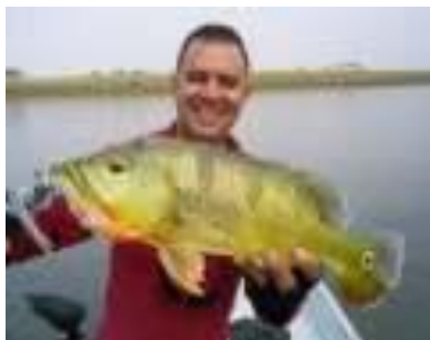
Figura 07 - Manuseio do Peixe: De preferência, deve-se manusear o peixe com as mãos molhadas, evitando passá-las pelo corpo do peixe, para não tirar sua mucosa, a qual é importante para defesa de infecções e necessária para a sua hidrodinâmica.

Figura 06 - Guelra: Sob nenhuma condição deve-se colocar a mão na guelra dos peixes. Por ser zona de grande irrigação sanguínea, é uma porta aberta para infecções.