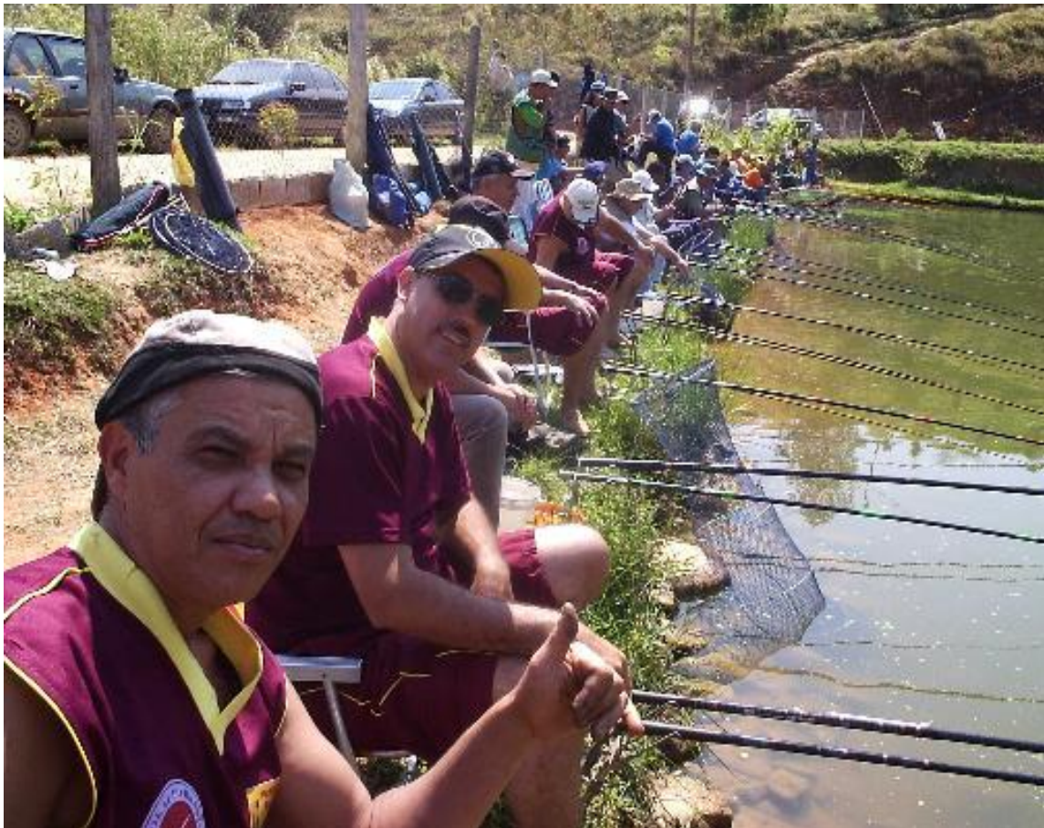
Figura 10 - Campeonato Paulista em pesque-e-pague – Agosto 2007