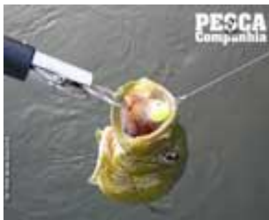
Figura 13 - Tucunaré fígado por apetrechos que molestam a espécie

A figura 13 visualiza apetrechos que molestam o animal, conforme decreto federal nº 24.645/34: