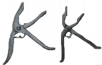
Figura 03 - Alicate de contenção: como o alicate foi desenvolvido especificamente para este fim, é fácil de usar e proporcionar um bom domínio sobre o peixe. Na parte inferior da boca, pode arranhar o tecido bucal ou, em algumas espécies, pressionar parte da guelra.

facilitando infecções por vírus e bactérias.