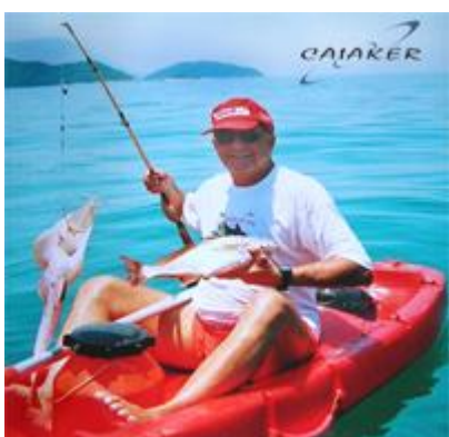
Figura 06 - Guelra: Sob nenhuma condição deve-se colocar a mão na guelra dos peixes. Por ser zona de grande irrigação sanguínea, é uma porta aberta para infecções.

Esse é um dos fatores mais prejudiciais à saúde do peixe. Cair das mãos, batendo no barco ou nas pedras é bastante comprometedor, não sendo raro o peixe morrer com o baque.