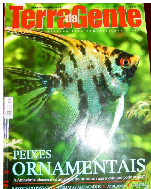
Figura 14: Capa 11 da Revista Terra da Gente

CAPA: ANO 1 - Número 11 / 2005 - Peixe Ornamental - Preço de Capa: R$ 8,90