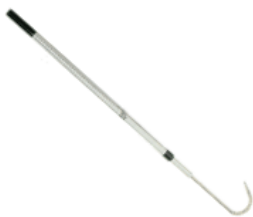
Figura 04 - Bicheiro: bicheiros pequenos, desenvolvidos para tirar o peixe da água, deixam os peixes quase sem nenhuma marca, se forem utilizados corretamente. O bicheiro é sempre introduzido de dentro da boca para fora, devendo perfurar a fina pele existente por detrás da mandíbula. Se mal usado, pode machucar perfurando outras partes da boca do peixe. (Revista Bíblia do Pescador, 1999, p.23-5)

Figura 03 - Alicate de contenção: como o alicate foi desenvolvido especificamente para este fim, é fácil de usar e proporcionar um bom domínio sobre o peixe. Na parte inferior da boca, pode arranhar o tecido bucal ou, em algumas espécies, pressionar parte da guelra.