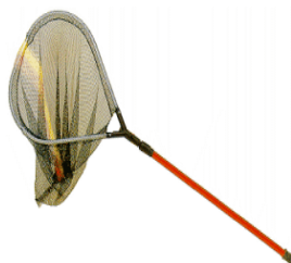
Figura 02 - Passaguá: É prático, eficiente e dá bastante segurança ao pescador. Por outro lado, o contato do peixe com a rede é prejudicial, pois a mesma retira boa parte de sua mucosa e até algumas escamas, diminuindo a resistência e

O ideal é não usar nenhum equipamento para retirar o peixe da água. Se fosse possível só manusear os peixes com as mãos, preferencialmente com elas, seria o meio mais recomendável. Como existem situações em que o pescador precisa usar o recurso de um equipamento, novos recursos surgiram como, por exemplo, o passaguá, o alicate de contenção e o bicheiro.