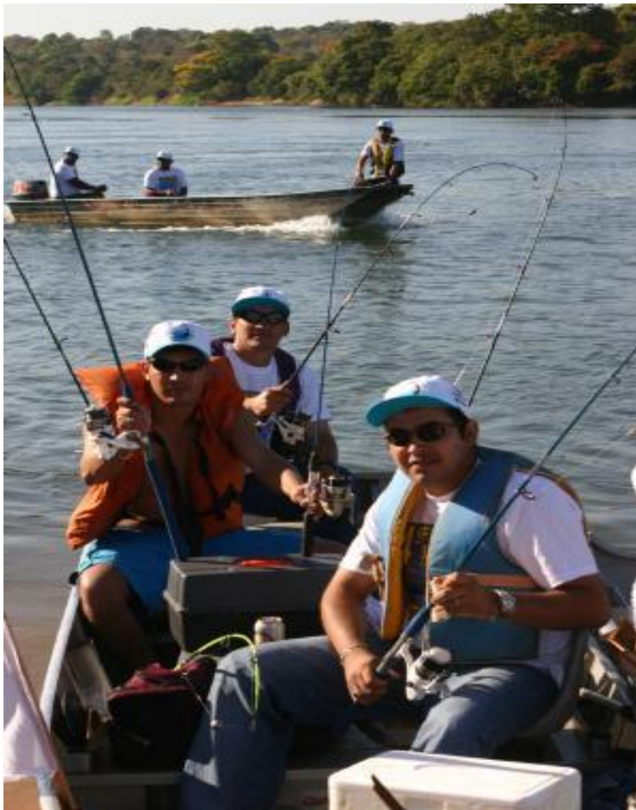
Figura 11 - Campeonato de pesca esportiva no Mato Grosso