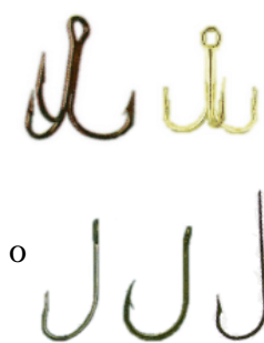
Figura 01 – Anzóis para pesca Esportiva

ANZOL: A utilização de anzol sem farpa machuca menos o peixe, principalmente na hora da retirada do mesmo. A sensação de que o peixe escapa com facilidade pela não utilização da farpa não corresponde à realidade. Mesmo no caso de peixes saltadores basta o pescador evitar que a linha fique bamba. Em algumas pescarias, dependendo do tamanho do peixe, é comum se cortar a linha para liberação do peixe. Nesta situação, é recomendado o uso de anzol feito com material de rápida corrosão, para que em poucos dias se solte da boca do peixe. Não se deve cortar a linha próxima ao anzol, pois um pequeno pedaço de linha é pouco flexível e poderá perfurar o estômago do peixe se ele vier a engolir o anzol; 50 cm são suficientes para manter a flexibilidade da linha. (PNDPA).