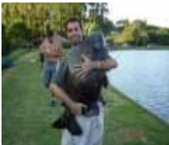
Figura 05 – Peixe de couro -

água pode provocar contaminações em determinadas espécies, em particular peixe de couro.