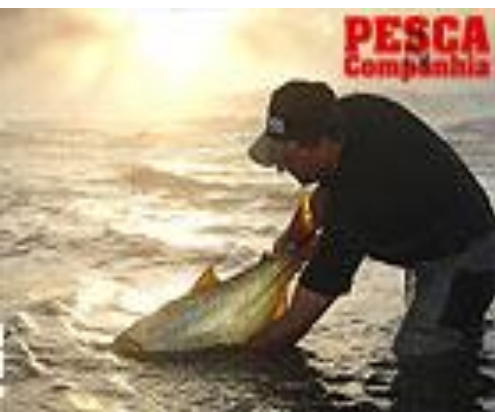
Figura 08 - Devolução do peixe à água:

Conforme o Programa Nacional de Desenvolvimento da Pesca Amadora, é importante não jogar o peixe na água, deixando-o "ao Deus dará". Cansado e desorientado, o exemplar se torna uma presa fácil para outras espécies predadoras. A orientação é para que o pescador coloque o peixe na água, apoiando-o com as mãos por baixo do corpo para que o exemplar se recupere lentamente e só saia quando estiver em condições e por conta própria. Suas chances de defesa aumentam muito e soltá-lo na