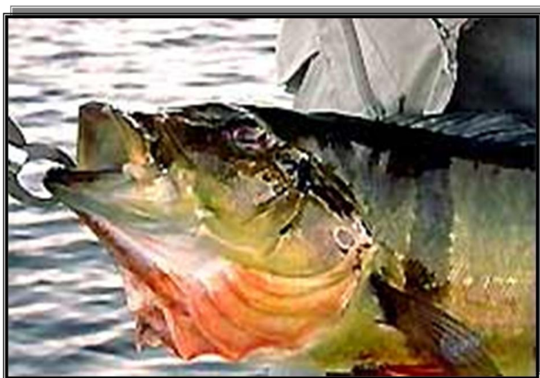
Figura 12 : Ato voluntário de ferir a espécie