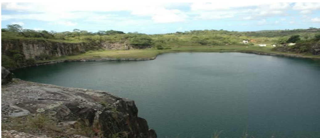
Figura 3: cava de mineração desativada

Fonte: http://www.mgaminerao.com.br/pordentro/noticias/cavas.html . Acesso em 02.06.2016.