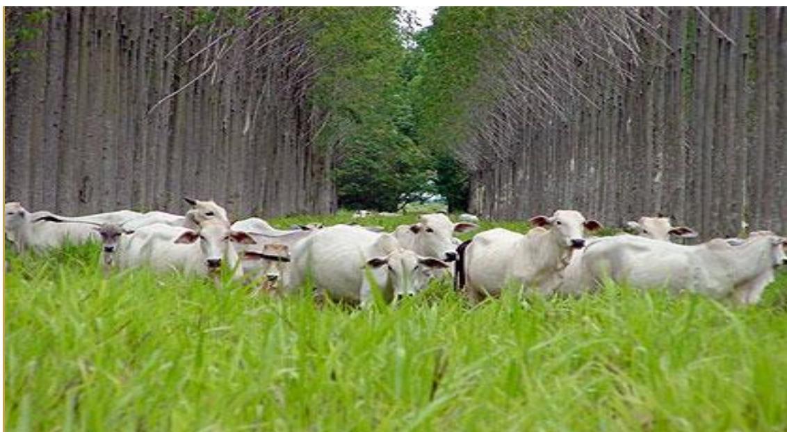
Figura 2: pecuária em meio arbóreo