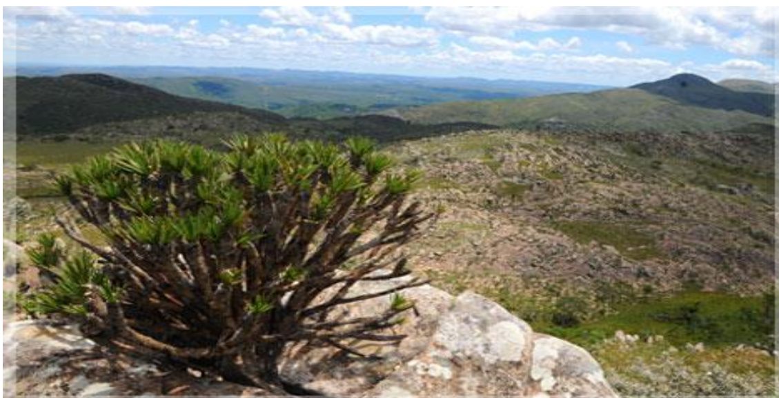
Vista parcial da Serra do Cipó com uma "Vellozia sp.", em primeiro plano, e espécies pesquisadas pelo grupo do Laboratório de Ecologia Funcional de Plantas (abaixo)