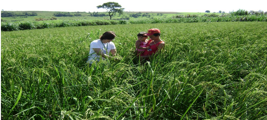
Figura 2 - Área de cultivo de arroz agroecológico das famílias amostradas, Assentamento Ander Rodolfo Henrique, Diamante D'Oeste e Vera Cruz do Oeste, Paraná, 2004.

O programa produtivo do PDA foi elaborado baseado no regimento interno do assentamento que proíbe o uso de agrotóxicos – inseticidas e fungicidas - e fertilizantes sintéticos – ureia e superfosfato; além da aplicação de produtos químicos nos animais e na prática das queimadas. Sendo assim, o próprio plano de desenvolvimento sustentável do assentamento é uma proposta agroecológica de ruptura com o modelo convencional de agricultura (SANTOS, 2011).