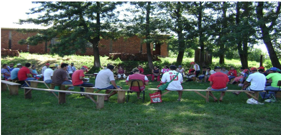
Fonte: Dados da pesquisa, 2015. Foto arquivo da memória do assentamento.