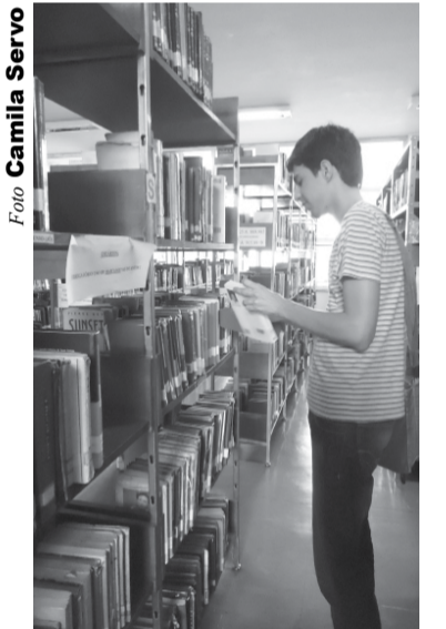
Biblioteca tenta ampliar seu acervo de livros

e-mail: bibliotecamunicipal@araraquara.sp.gov.br