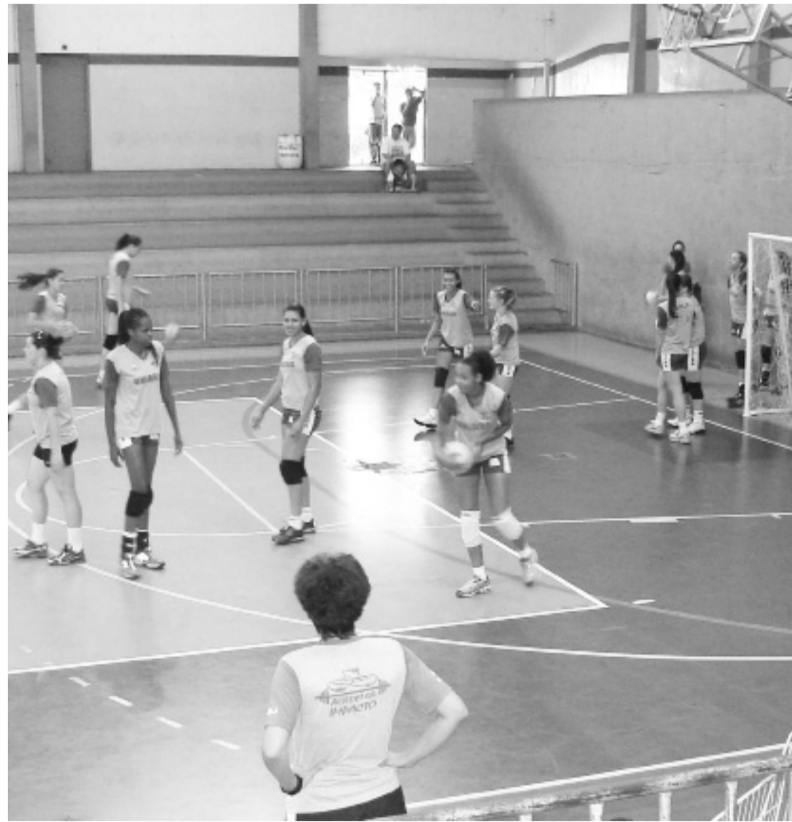
Equipe de voleibol da Uniara já conquistou aproximadamente 20 títulos

Interessados podem procurar treinadores e se inscrever em peneiras de seleção