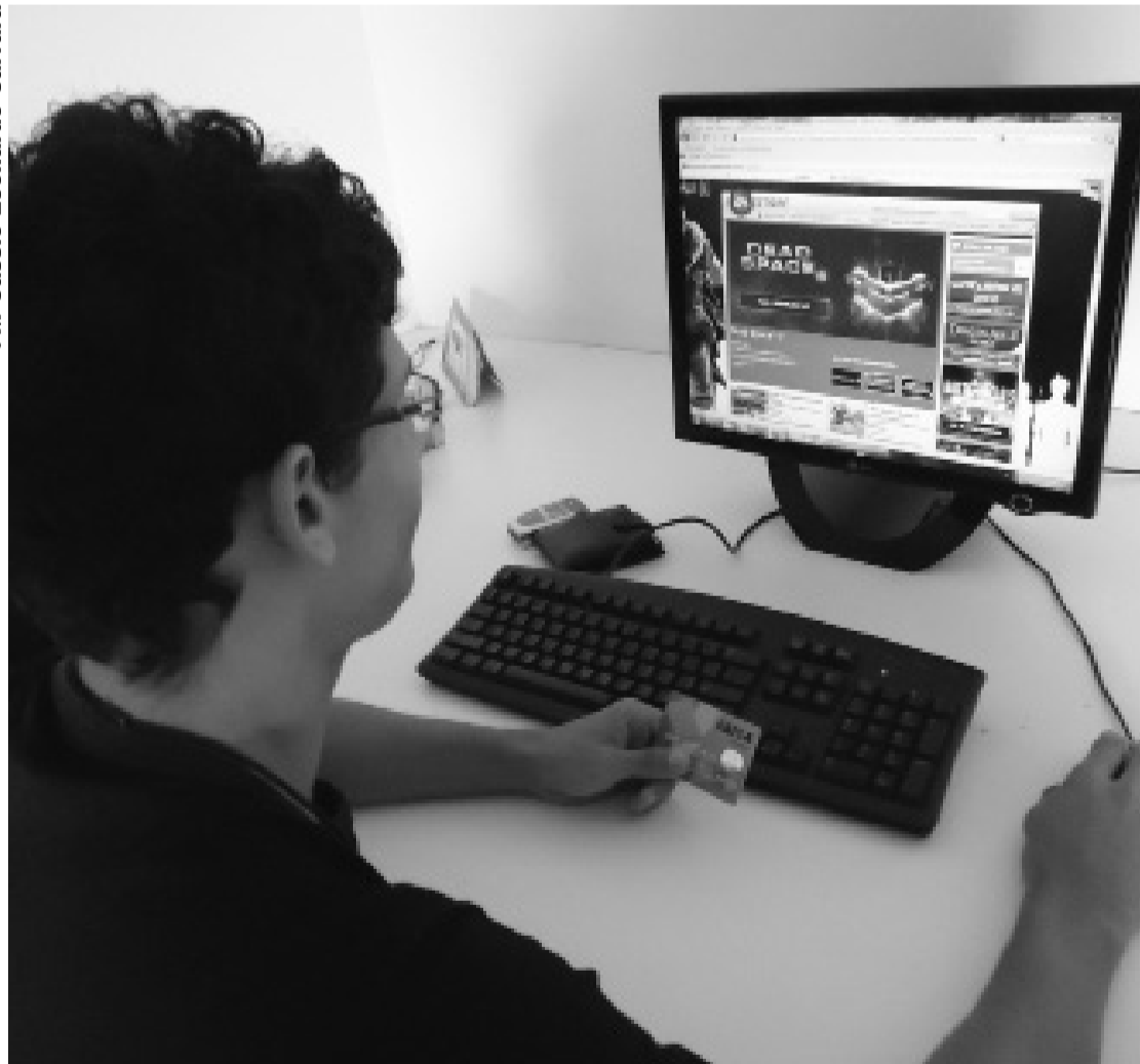
Venda de games online vem crescendo e aperta combate à pirataria

ve, etc.) e foi essa conotação saudosista que me chamou atenção. Estimo que até hoje tenha baixado pouco mais de dez títulos”.