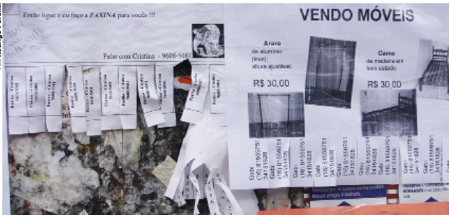
Uma das melhores dicas para o consumidor não ter prejuízo é pesquisar bem antes de comprar

Na hora de comprar móveis para a república, os estudantes que começam vida universitária nas cidades da região podem economizar até 50% se optarem por usados. Lojas especializadas oferecem boas opções de móveis em bom estado, tanto em Araraquara quanto em São Carlos. A compra pode ser ainda melhor se for feita diretamente com particulares. PÁG. 3