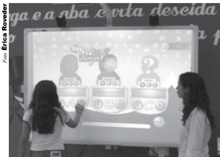
Alunas ensinam o que aprenderam em pouco tempo de uso

Formada por um painel sensível ao toque de uma caneta especial, acoplado a um projetor multimídia e a um computador, a lousa digital aparece como novidade em escolas particulares e públicas como ferramenta moderna do ensino. O equipamento é uma atualização que veio da lousa de fundo verde ou preto, passa pelo painel branco e o canetão, e chega a esse quadro, que exibe imagens paradas ou com vídeo, aceita a intervenção do indivíduo e, movida por um programa de computador, ainda pode interagir, dando respostas ou conclusões.