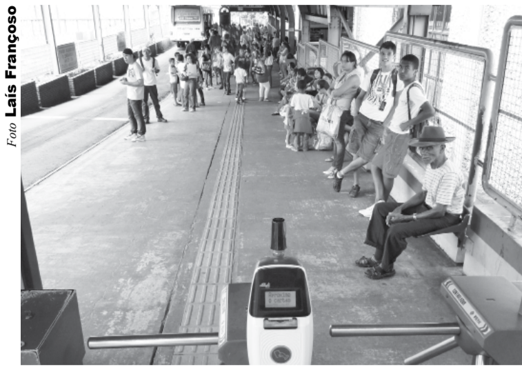
Novo dispositivo eletrônico na entrada do Terminal

as regras e subiu em um ônibus sem realizar o que a tinha levado ao local”. Com relação a estudantes, a assessoria de imprensa afirma que não é caso de multa o uso do transporte público em diversos horários, mas se faz necessária a apresentação de um comprovante de contrato com a empresa na qual o estagiário atua. “Sendo assim, o estudante poderá recarregar seu cartão em até 100 créditos ao mês, conforme sua necessidade. Se não comprovar, o máximo que poderá constar em seu cartão são 50 créditos por mês”, esclarece a assessoria da empresa.