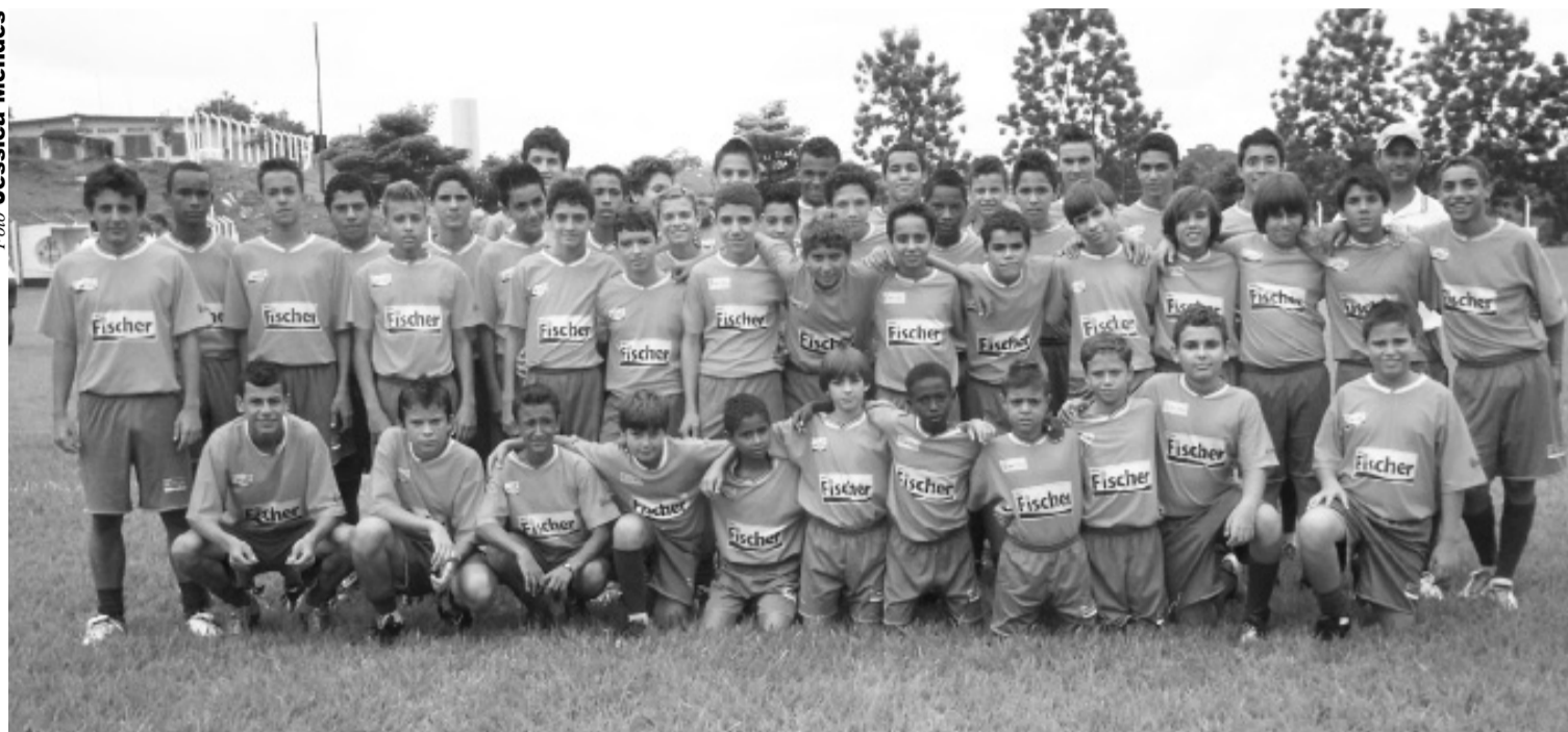
Garotos do projeto “Bom de Bola, Bom na Escola” em dia de treinamento

Para as pessoas que não seguiram a carreira esportiva, o