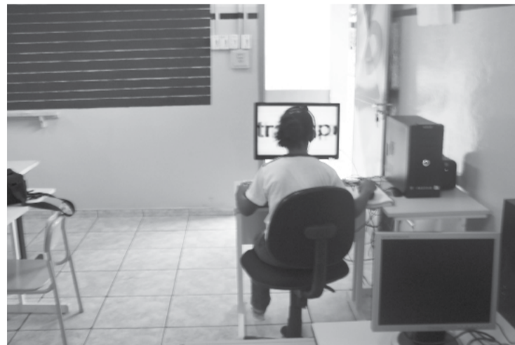
Equipamentos adaptados facilitam a utilização pelos atendidos

As atribuições relativas à Educação Especial passaram a ser responsabilidade dos municípios desde 1996. Em 1998 a cidade de Novo Horizonte instalou a sala multifuncional de ensino, mantida sob coordenação da DMEC. O município destacou-se em 2009 no Índice de Desenvolvimento da Educação Básica (IDEB) com a nota 6,2, superior ao estipulado pelo Governo Federal. Esta média é projetada para ser alcançada em 2020.