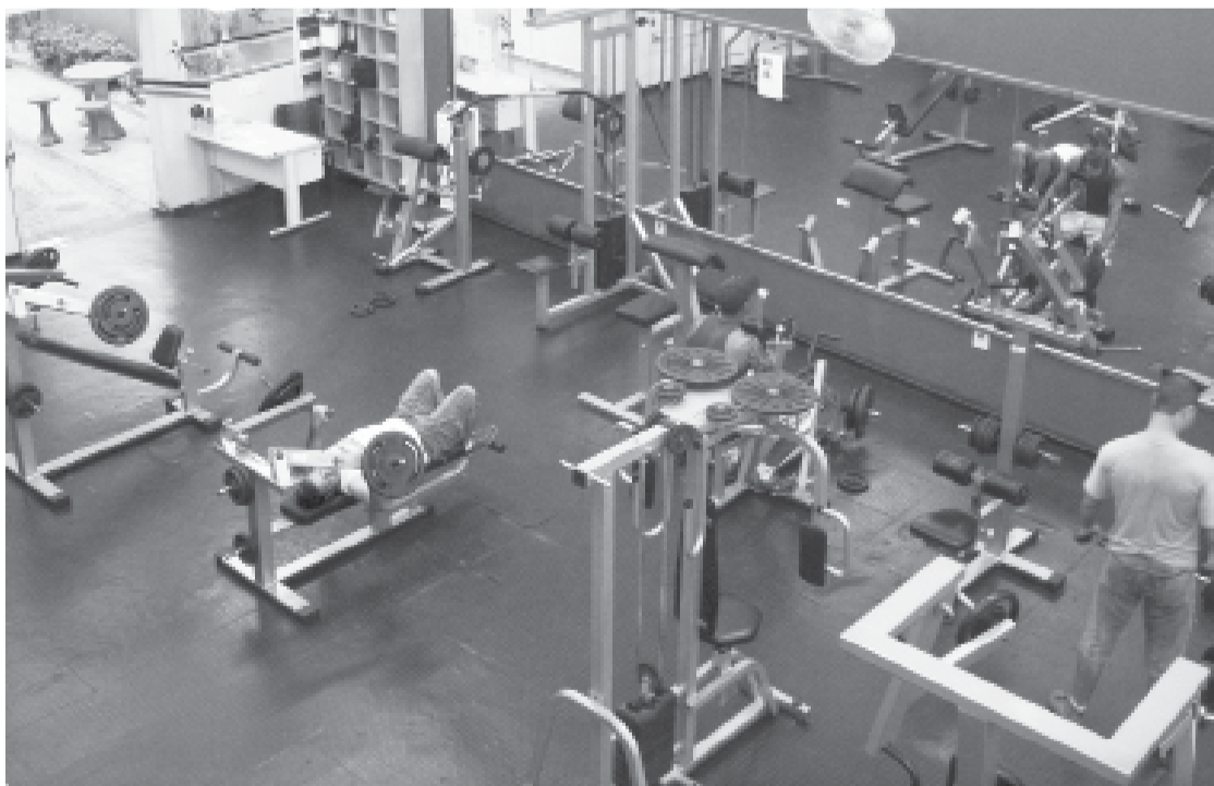
É preciso acompanhamento profissional para a prática de exercícios físicos

A autoidolatria rompe o limite do aceitável e leva jovens a excessos nas academias