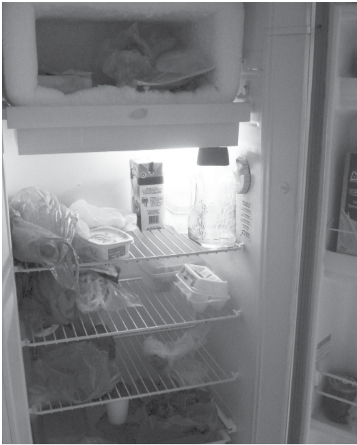
Na república "Monopólio" em Araraquara a rotina de alimentação é "razoável"

Universitários relatam suas rotinas alimentares e mostram que morar longe de casa também ensina como se alimentar, mesmo com a correria e a falta de tempo